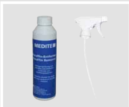
Paraffin-Entferner Flasche á 250 ml (inkl. Sprühpumpe) Art.-Nr. 41-5600-00

Diese Artikel und weitere erhalten Sie auch in unserem onlineshop