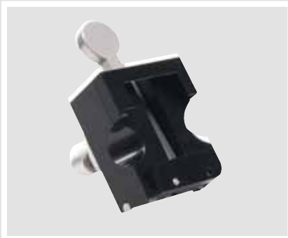
Universal-Objektklammer für Standard-Kassetten, Art.-Nr. 24-3136-00

Bei Bedarf ist ein Klingenthaler für Einwegklingen mit Hochprofil optional erhältlich, Art.-Nr. 24-3128-00.