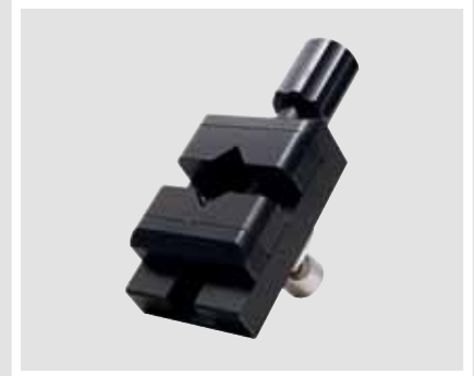
Objektklammer mit V-Einsatz für sonstige Proben, Art.-Nr. 24-3031-00

Bei der Universal-Objektklammer handelt es sich um ein Objektschnellwechselsystem für Standard-Kassetten. An der Kassettenklammer befindet sich ein orientierbarer Adapter, über den die Objektklammern am Zylinderkopf befestigt werden. Dies ermöglicht eine genaue Orientierung der Proben. Optional ist eine Objektklammer mit V-Einsatz erhältlich.