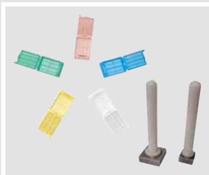
Einbettkassetten mit Kunststoffdeckel, abreißbar, Art.-Nr. 46-1100-00 ff. Andrückstempel für Gewebeproben Art.-Nr. 46-0910-00/46-0911-00