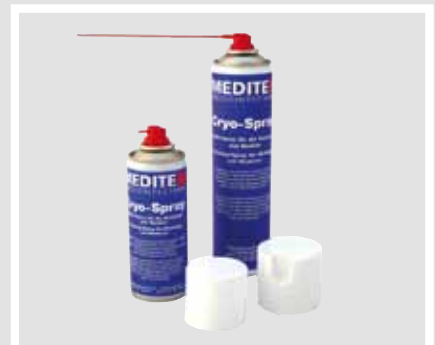
Cryo-Spray 200 ml Dose: Art.-Nr. 40-0110-00 400 ml Dose: Art.-Nr. 40-0111-00

08-2010 / Technische Änderungen vorbehalten.