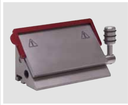
Klingenhalter für Einwegklingen mit Niederprofil, Art.-Nr. 24-3131-00

Im Klingenthaler für Einwegklingen können handelsübliche Schmalbandklingen verwendet werden. Der Messerhalter verfügt über eine seitliche Verschiebefunktion, so daß die gesamte Schneidelänge optimal genutzt wird. Zum Anpassen an die jeweiligen Schnitthanforderungen kann der Freiwinkel zwischen Mikrotomklinge und Schnittobjekt verstellt werden.